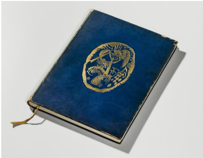
Vorkant Der Blaue Reiter