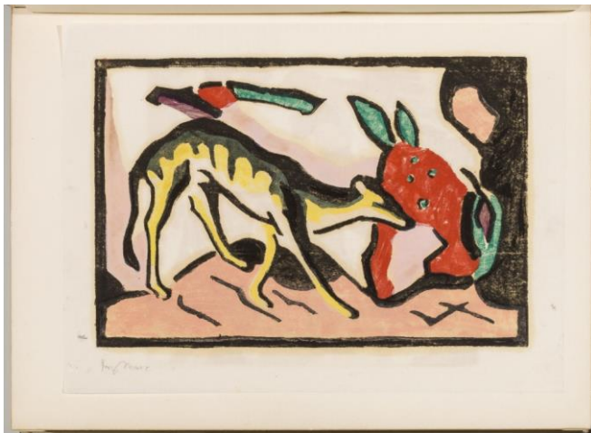
Franz Marc, Fabeltier , houtsnede 1912